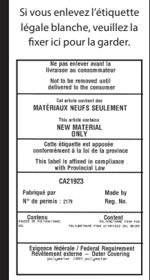
EXEMPLE D'UNE ÉTIQUETTE LÉGALE