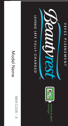
EXEMPLE D'UNE ÉTIQUETTE DE PRODUIT